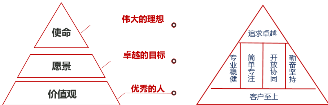
（方正证券企业文化体系模型）